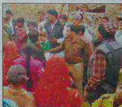
Police arrive at Irauli Gurjar in Mathura to arrest the seven missionaries

"Police received a complaint from a villager after which seven people were