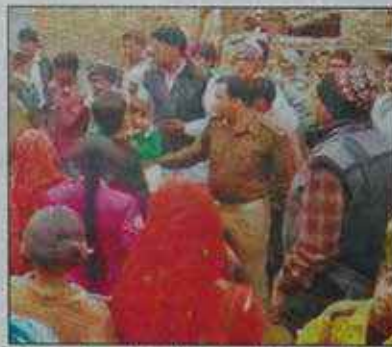
Police arrive at Irauli Gurjar in Mathura to arrest the seven missionaries

"Police received a complaint from a villager after which seven people were