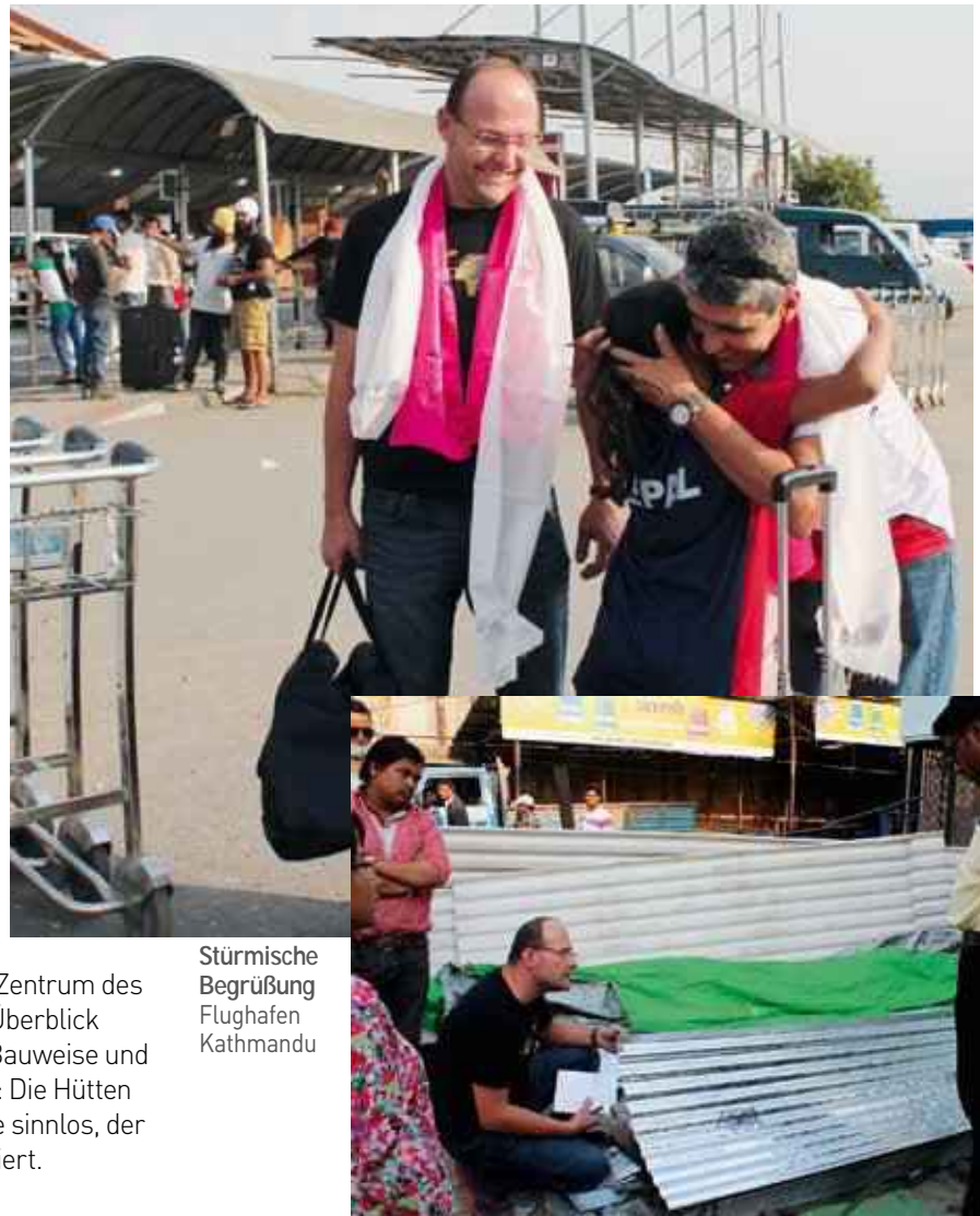
Stürmische Begrüßung Flughafen Kathmandu