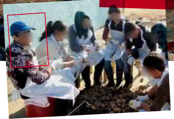
Hände abgehackt, enthauptet Küchenjunge in Kobane

In monatelangen Kämpfen hatte der IS 80–90 % der Infrastruktur Kobanes zerstört. Es fehlt an allem, besonders an Strom und Wasser; ein normales Leben ist nicht möglich. Dennoch kommen die Vertriebenen zurück, siedeln sich in Tausenden von Zelten an.