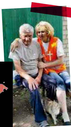
Ukraine Die vom Krieg Betroffenen brauchen mehr als nur materielle Hilfe